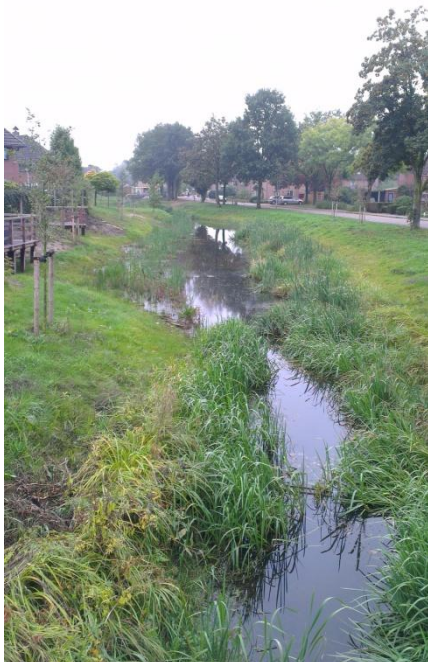
Zicht vanaf de Ganzenbrug

Huidig beeld op de Regge in de Hogenkamp: