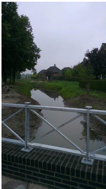
Zicht vanaf de Putterstraat