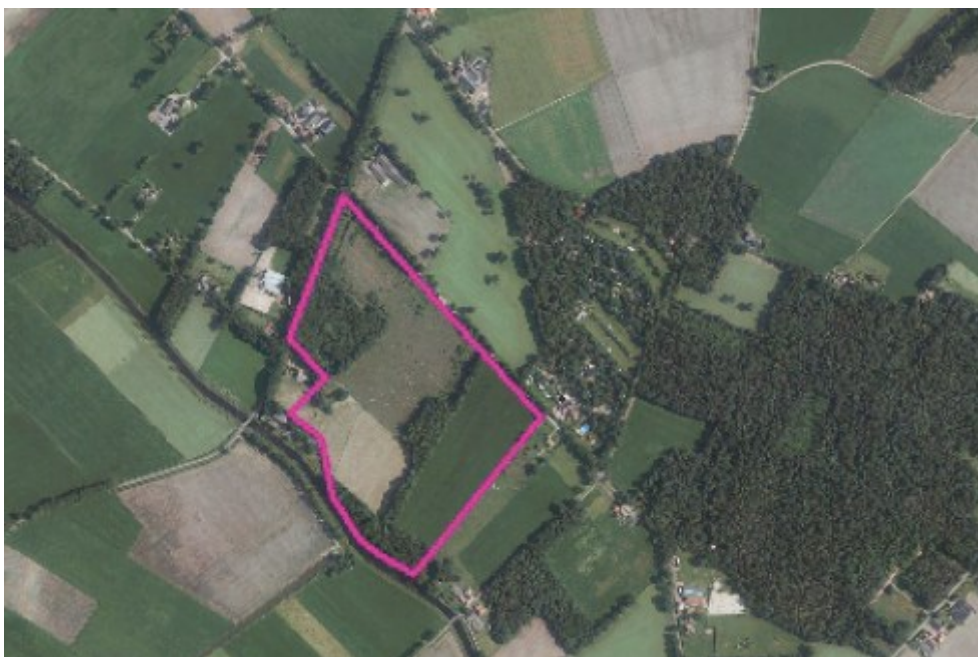
Luchtfoto ligging projectlocatie

1.1 Wij stellen u voor om in te stemmen met het realiseren van een nieuw landgoed aan de Enkelaarsweg te Markelo. Het plan is om aan de Enkelaarsweg in Markelo een nieuw landgoed met een oppervlakte van 16 ha te realiseren. De initiatiefnemer is voornemens om een nieuw landgoed met een landhuis en een extra woning van 750 m 3 te realiseren. Waarbij 30% (van de 16 ha) omgezet wordt naar natuur/bos. De percelen zijn inmiddels gerangschikt onder de Natuurschoonwet. Op 12 september 2017 heeft uw college besloten in principe medewerking te verlenen aan het realiseren van dit nieuwelandgoed mits er een ontwikkelingsplan wordt opgesteld waaruit blijkt hoe het landschap wordt versterkt en de nieuwe bebouwing allure heeft. De initiatiefnemer heeft het plan uitgewerkt dat nu, conform het beleid, voor instemming wordt voorgelegd aan de gemeenteraad.. Het "oude" plan, waarbij er een nieuw landgoed met 14 zorgappartementen gerealiseerd zou worden gaat niet meer door.