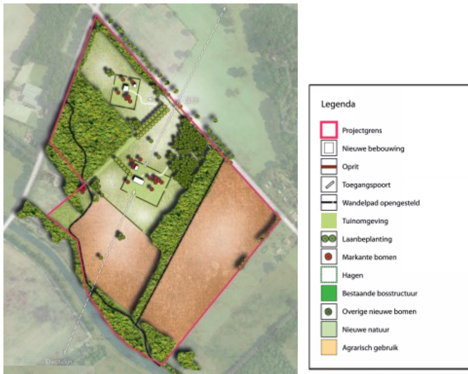
Inrichtingsschets nieuw landgoed

Om ervoor te zorgen dat er een landhuis van allure gerealiseerd wordt en de extra woning qua beeldkwaliteit ook een samenhang heeft met het landhuis, wordt naast het bestemmingsplan ook een beeldkwaliteitsplan opgesteld waarin dat vastgelegd wordt.