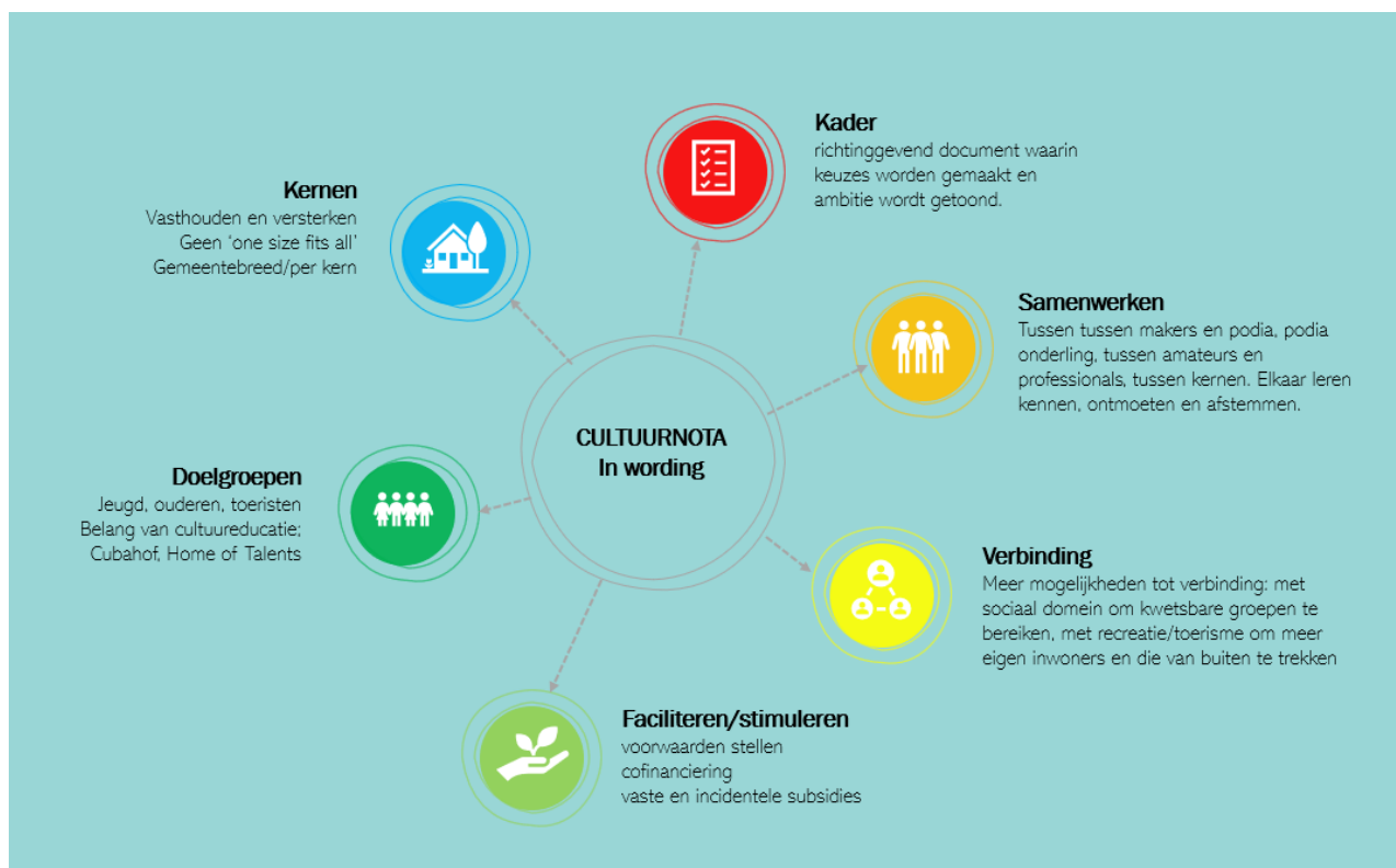
Figuur 1 Gedeelde uitgangspunten voor cultuurnota

Uit de startsessies met de betrokken partijen zijn een aantal gedeelde uitgangspunten voor deze Cultuurnota 2022-2030 naar voren gekomen die in de visie op cultuur worden meegenomen (zie ook figuur 1).