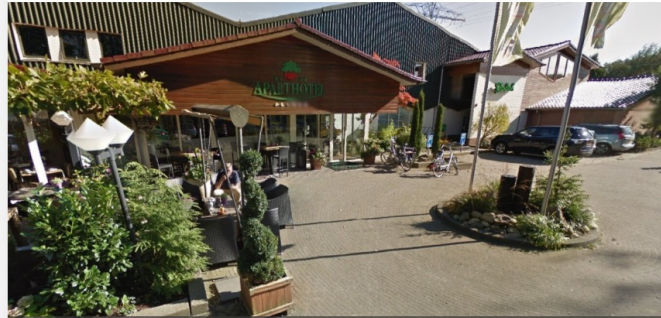
Aparthotel Delden gaat voor een periode van minimaal vier maanden dienen als opvanglocatie voor minderjarige vluchtelingen.

Aparthotel Delden gaat voor een periode van minimaal vier maanden dienen als opvanglocatie voor minderjarige vluchtelingen, zogeheten AMV'ers. Het gaat om een groep van maximaal vijftig jonge asielzoekers, die nu nog zijn ondergebracht in Heino. De opvang in Delden geldt van 7 maart tot en met 1 juli 2024 en kan worden verlengd tot 1 maart 2025.